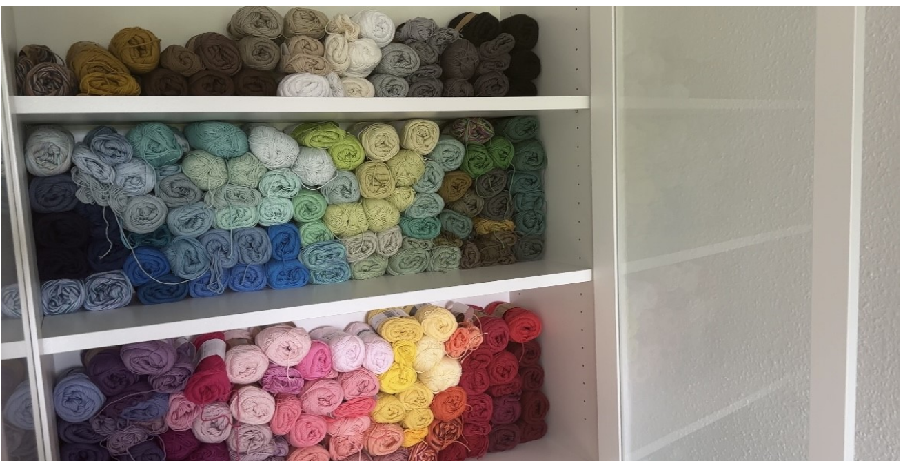
Ikke et eneste garnøgler ligger forkert.