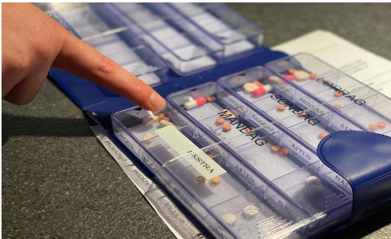
De mange piller er sorteret efter ugedagene.

I de 11 år, hun var diagnosticeret paranoid skizofreni, har hun været på 13 forskellige præparater, der alle har fået hende til at høre stemmer. De selvsamme stemmer har også været en væsentlig årsag til, at hun har følt sig nødsaget til at selvskade og har været indlagt mere end 200 gange. Så da hun endelig sidste sommer blev gendiagnosticeret og fik bortskrevet sin skizofreni, faldt en tung sten også fra hendes hjerte, udtrykker hun lettet, mens hun dimser med en Tangle Fuzzy, der er en slags antistress-slange.